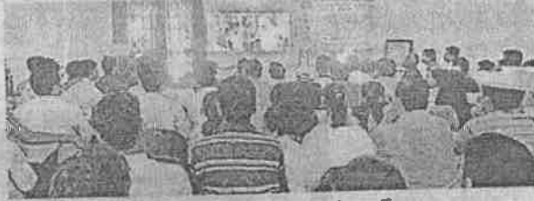
ताराबाई शिंदे अभ्यास केंद्रात चित्रपट पाहताना विद्यार्थी.