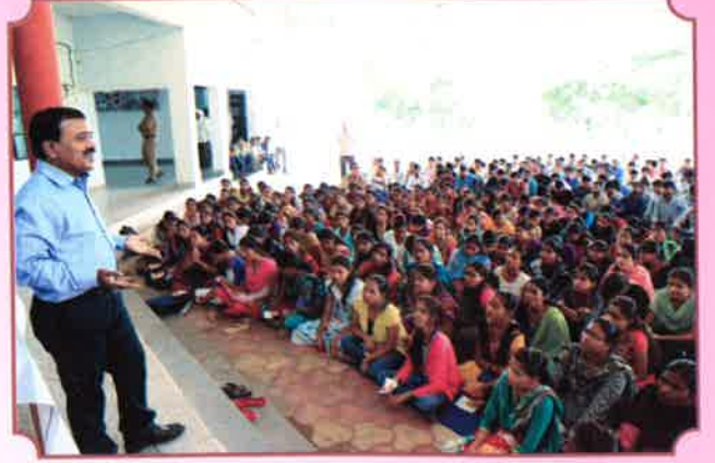
२ ऑक्टोबर महात्मा गांधी जयंती