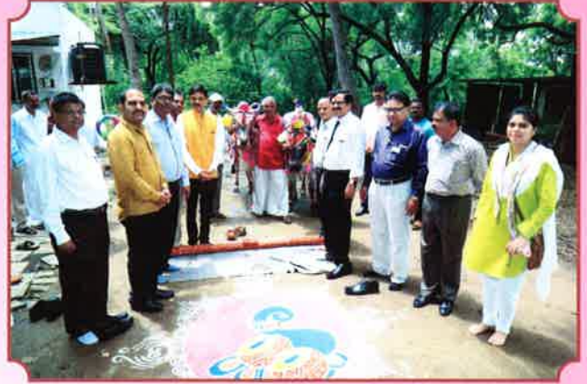
कमवा आणि शिका येथे पोळा सन साजरा करताना