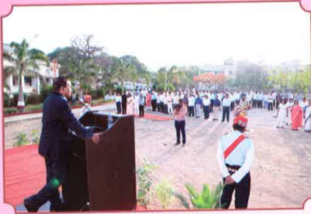
१ मे महाराष्ट्र दिन