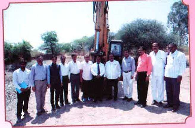
जलयुक्त विद्यापीठ २०१७