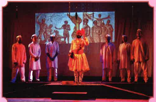
६८ वा मराठवाडा मुक्तिसंग्रामदिनानिमित्त नाटक सादर करताना