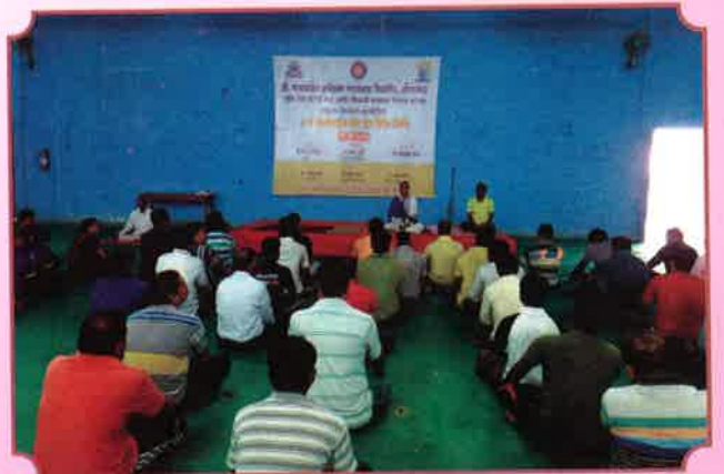
२ रा आंतरराष्ट्रीय योग दिवस