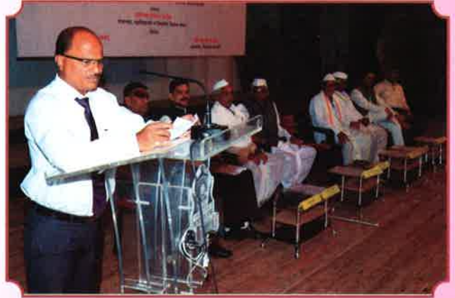
६८ वा मराठवाडा मुक्तिसंग्रामदिन