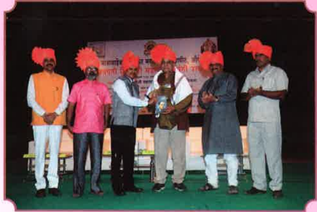
छत्रपती शिवाजी महाराज जयंती उत्सव २०१७