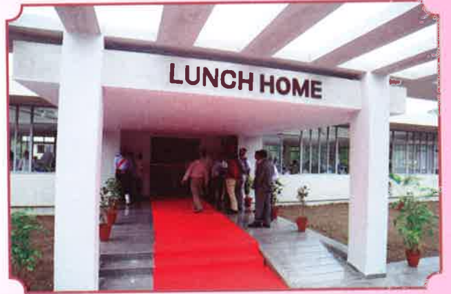
२३ ऑगस्ट लंचहोमचे उद्घाटन २०१६