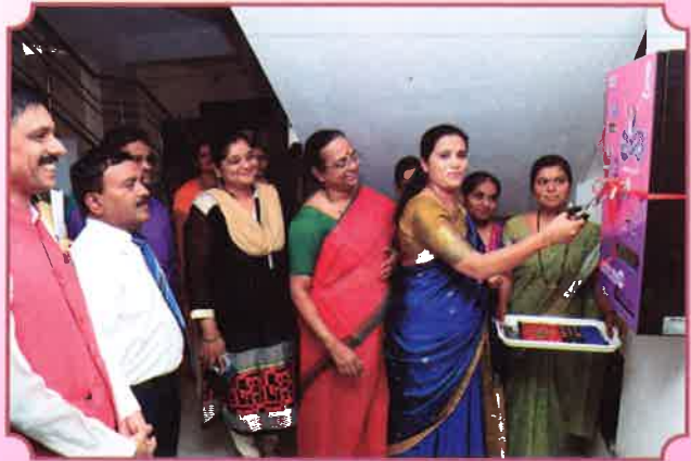
८ मार्च जागतिक महिला दिन २०१७