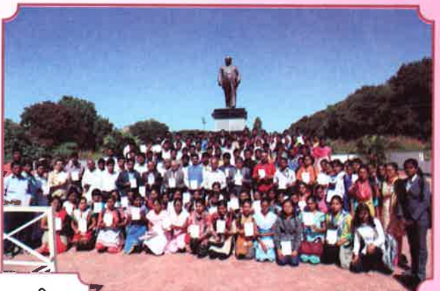
२६ नोव्हेंबर भारतीय संविधान दिन २०१७