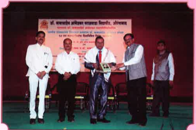
१२ डिसेंबर भारतरत्न डॉ. बाबासाहेब आंबेडकर यांच्या ६० व्या महापरिनिर्वाण दिन