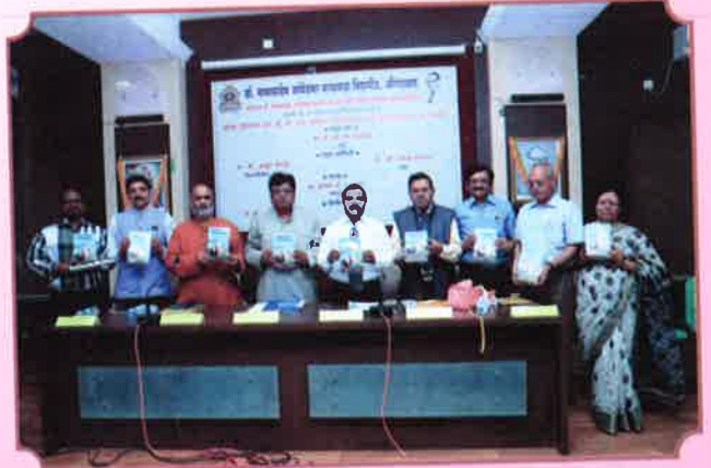
भारतरत्न डॉ. बाबासाहेब आंबेडकर यांच्या १२६ व्या जयंती निमित्त व्याख्यान व थामस जेफरसन अॅण्ड, डॉ. बी. आर. आंबेडकर कम्पॅरिटीव्ह स्टडी पुस्तक प्रकाशन