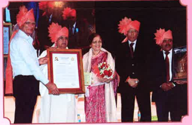
२३ ऑगस्ट ५८ वा वर्धापन दिन व जीवनगौरव पुरस्कार समारंभ