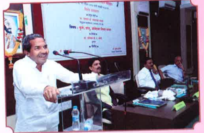
११ एप्रिल महात्मा ज्योतिबा फुले जयंती २०१७