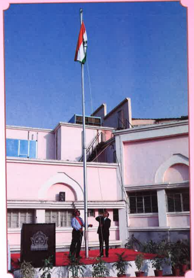
१ मे महाराष्ट्र दिन ध्वजारोहन