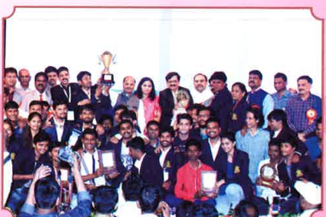
२०१६ 'इंद्रधनुष्य' विजेता संघ मुंबई विद्यापीठ, मुंबई