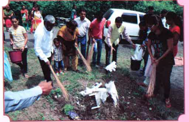
२ ऑक्टोबर महात्मा गांधी जयंती निमित्त स्वच्छता अभियान