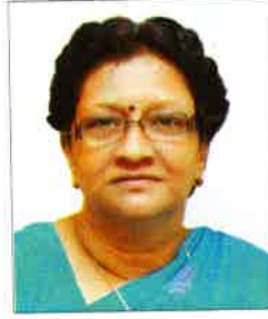
डॉ. प्रतिभा पाटील सदस्य