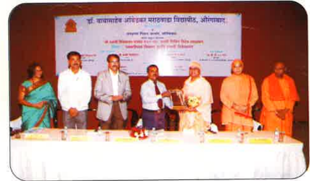
स्वामी विवेकानंद जयंती