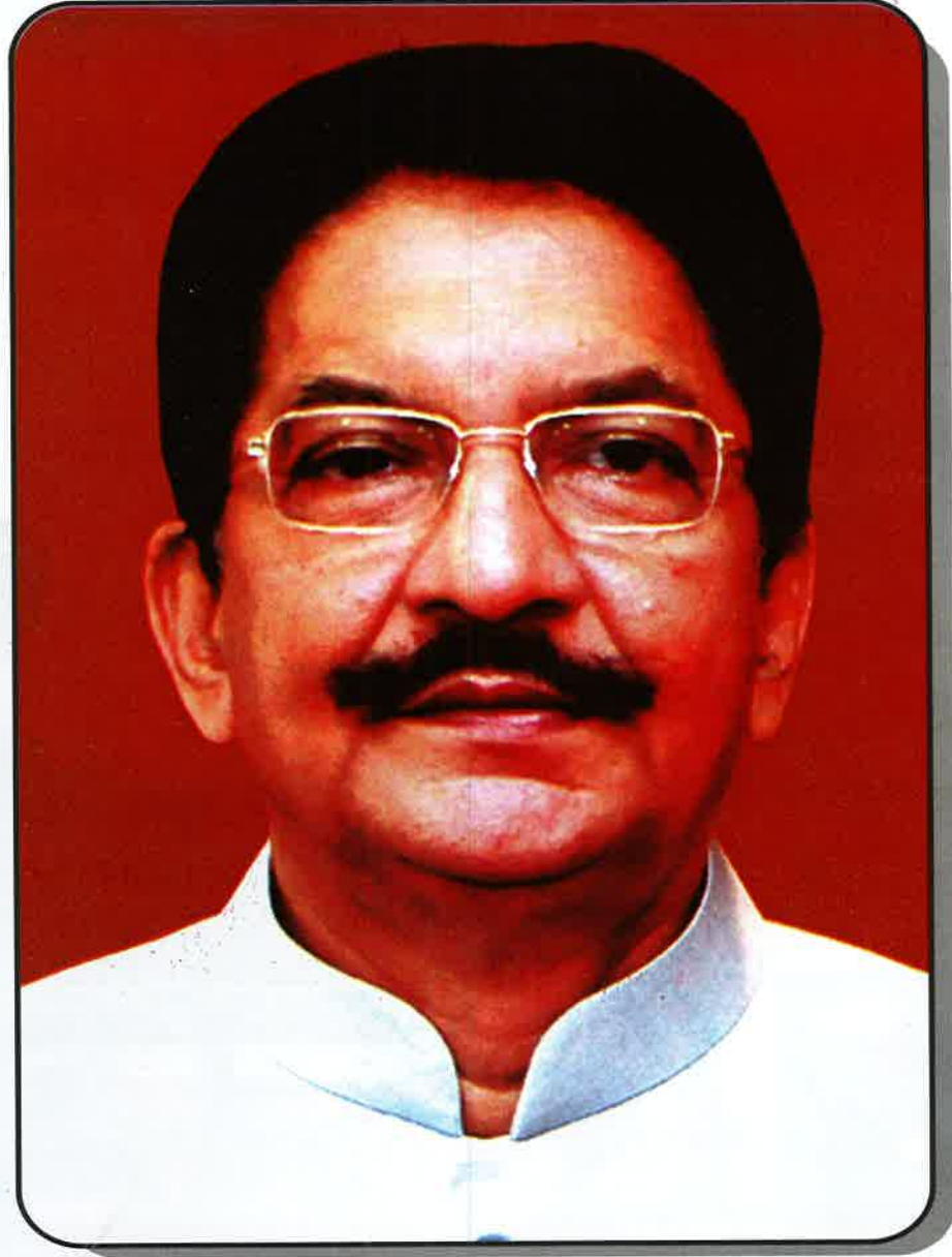
मा. श्री. चेन्नमनेनी विद्यासागर राव कुलपती तथा राज्यपाल, महाराष्ट्र राज्य