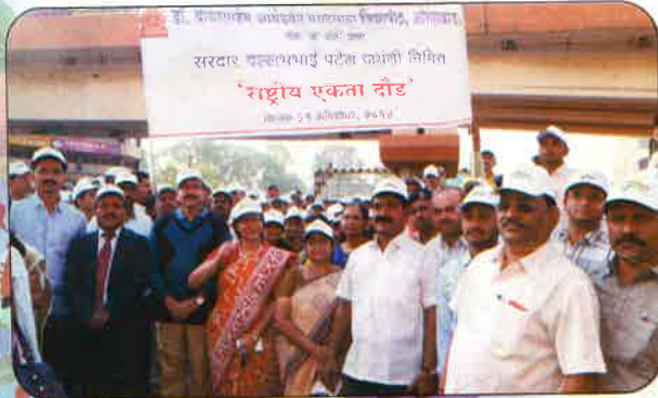
सर्दार वल्लभाई पटेल जयंती “राष्ट्रीय एकतादौड”