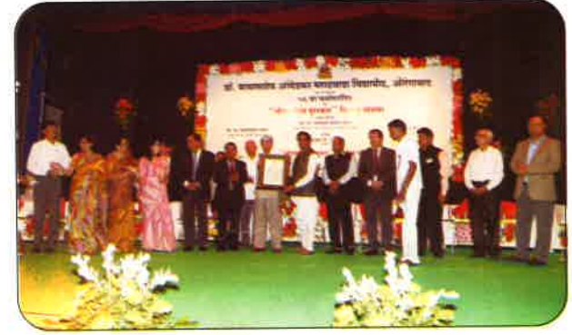
“जिवन गौरव पुरस्कार”