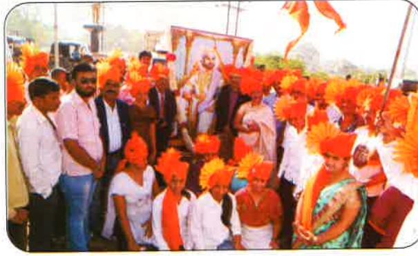
छत्रपती शिवाजी महाराज जयंती १९, फेब्रुवारी २०१५