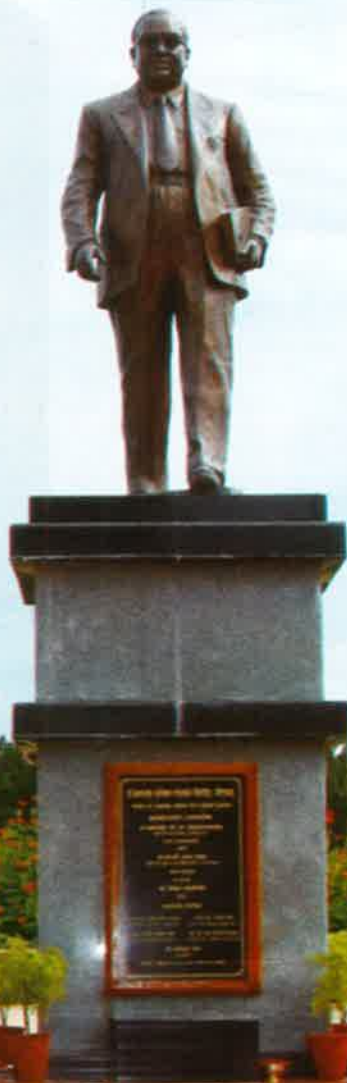
भारतरत्न डॉ. बाबासाहेब आंबेडकर