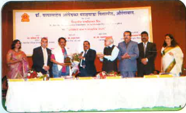
नाम विस्तार दिन १४, जानेवारी २०१५