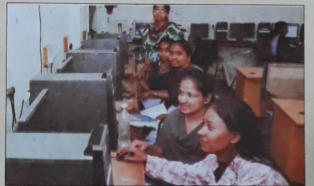
संगणक कक्षामध्ये संगणकावर प्रात्यक्षिक करतांना एम.फिल्. प्रशिक्षणार्थी.