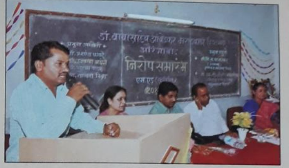
सुट्टीतील एम.एड्. निरोप समारोप प्रसंगी एम.एड्. प्रशिक्षणार्थी आपले मनोगत व्यक्त करतांना.