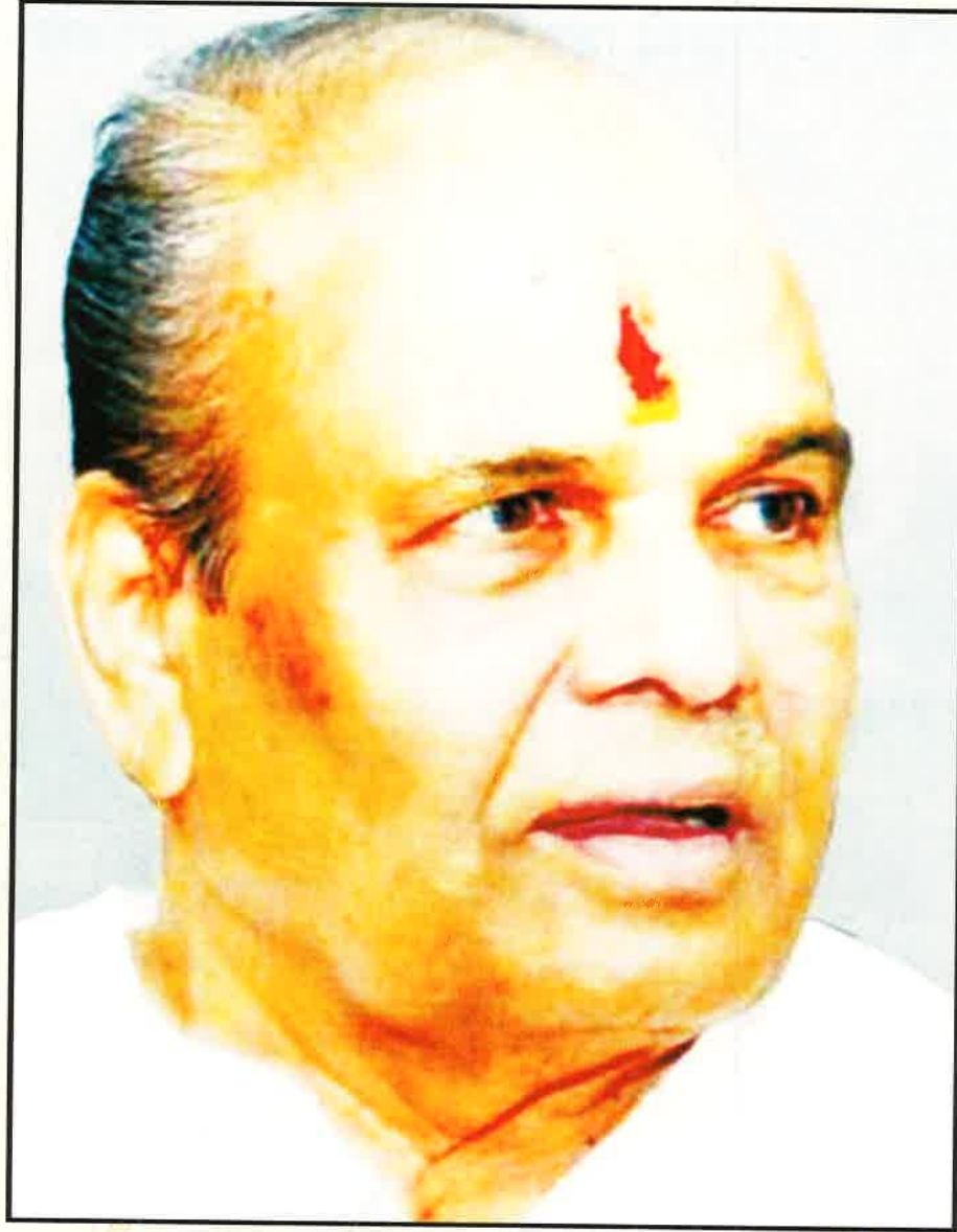
मा. महामहीम श्री. के. शंकरनारायणन् कुलपती तथा राज्यपाल, महाराष्ट्र राज्य