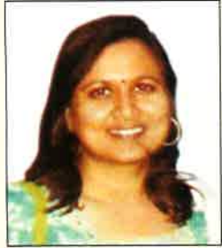
डॉ. बिना सेनार इतिहास विभाग