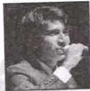
सद्दाम अमिन शेख देवगिरी महाविद्यालय औरंगाबाद.

मला मिळालेल्या यशामध्ये माझ्या गुरुजनांचा देखील सिंहाचा वाटा आहे. सध्या मी कथा खैरलांजी ह्या व्यावसायिक नाटकामध्ये काम करत आहे.