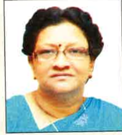
डॉ. प्रतिभा पाटील सदस्य