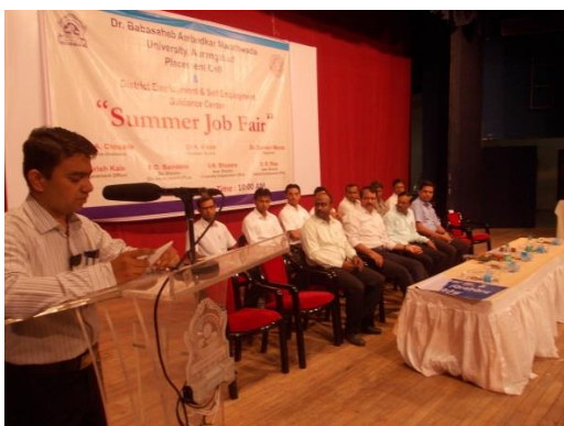
Placement Officer explaining the process