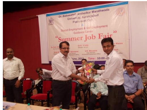
Director BCUD welcoming Employers