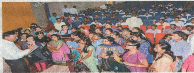
डॉ. बाबासाहेब आंबेडकर मराठवाडा विद्यापीठाच्या प्लेसमेंट सेल आणि जिल्हा रोजगार आणि स्वयंरोजगार विभागातर्फे आयोजित रोजगार मेळाव्यासाठी विद्यार्थ्यांनी प्रचंड गर्दी केली होती.

औरंगाबाद शहराच्या औद्योगिक क्षेत्रामध्ये कार्यरत असलेल्या मार्केटिंग, तांत्रिक सेवा, बँकिंग, इलेक्ट्रिकल आदी कंपन्यांमध्ये काही थेट नोकरीची व प्रशिक्षणार्थी म्हणून अनेक पदांसाठी विद्यापीठाच्या नाट्यगृहात मेळावा घेण्यात आला. मेळाव्यासाठी सकाळी १० वाजेपासूनच विद्यार्थ्यांची गर्दी जमली. विविध कंपन्यांतर्फे ३२१ जागांसाठी मुलाखती घेण्यात आल्या. यामध्ये अनेक मुले आणि मुलींना संधी मिळाली. दहावी उत्तीर्ण ते पदव्युत्तर