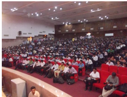
Employer Address to students