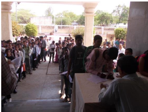
Students registration Counters

Photos of Summer Job Fair (Soft Copies are sent by email)