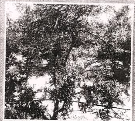
मधपेटी न ठेवलेल्या बागेतील झाडांची स्थिती