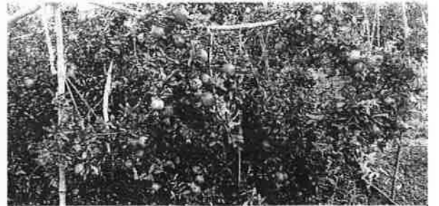
मधपेट्या ठेवण्याआधी डाळिंब बागेची स्थिती.